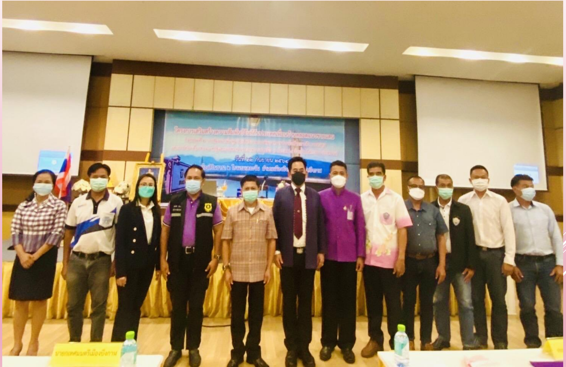
ภาพขณะพิธีมอบรางวัล